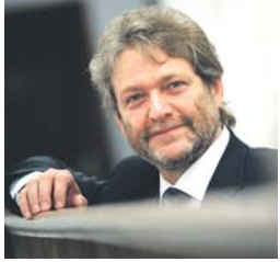
Landrat Manfred Nahrstedt