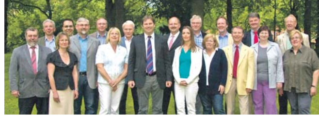
Ihr SPD - Team im Landkreis Lüneburg