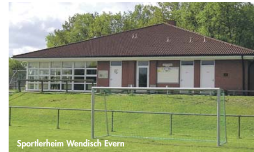
Sportlerheim Wendisch Evern