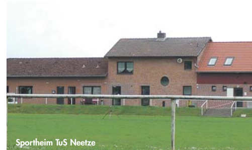
Sportheim TuS Neetze